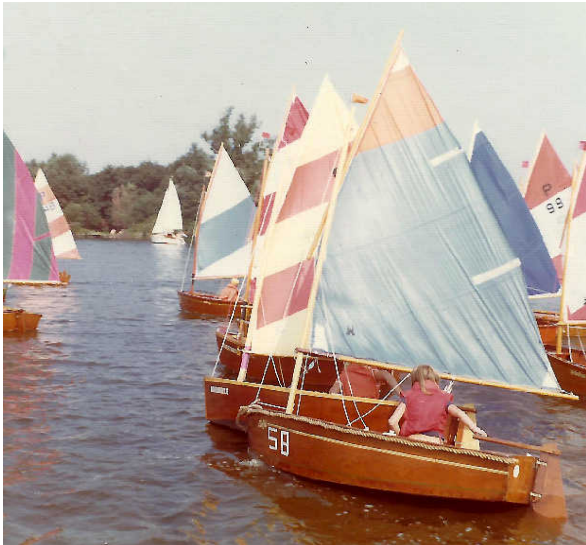
Een zeilwedstrijd met Piraatjes. Het bootje was een tijdlang even populair als de Optimist nu.